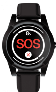
Kompy Watch 4G

Omdat de Kompy Watch 4G gebruik maakt van verschillende bandbreedtes heeft u altijd bereik. In geval van nood verstuurt u met één druk op de knop een signaal naar zorgverleners, familieleden of mantelzorgers. Zij zien de exacte locatie waar u zich bevindt en u kunt met elkaar spreken. De instelbare leefcirkels geven vrijheid met een veilig gevoel. Vergeet u wel eens uw medicijnen in te nemen of voldoende water te drinken? Hiervoor stelt u gemakkelijk een herinnering in op het apparaat. De stappenteller en hartslagmeter helpen om uw gezondheid in de gaten te houden.